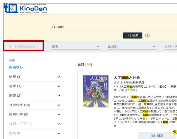
所蔵タイトルのみ

「未所蔵を含める」にチェックを入れると、本学にない電子書籍についても、内容紹介・試し読みを確認することができます。